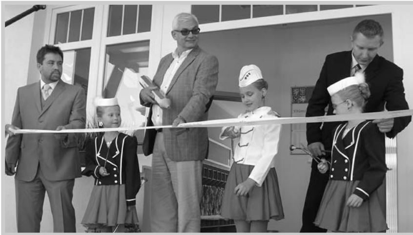
Se slavnostním přestřižením pásky pomáhaly mažoretky z kamenického klubu Hraběnky.

V pátek 16. září zažil Petřikov okamžik, který byl po dlouhá léta marným snem mnoha místních rodičů. Obec slavnostně otevřela svou Mateřskou školu Pastelka. Vzhledem k tomu, že pro výstavbu byly využity především finance z Fondu rozvoje obcí a měst Středočeského kraje, nechyběli v Petřikově v tento den „D“ ani jeho zástupci. Třebaže hejtman MUDr. David Rath musel nakonec původně plánovanou návštěvu zrušit, slavnostní otevření bylo velkolepé. Nema- lý podíl na tom měly především děti.