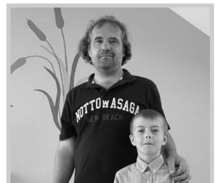
Mezi návštěvníky nechyběli oba Komárkové.