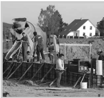
Do základů stavby začaly téct první kubíky betonu hned v říjnu 2010.