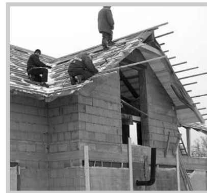
Před loňskými Vánocemi byla dokončena hrubá stavba schovaná pod střechou.