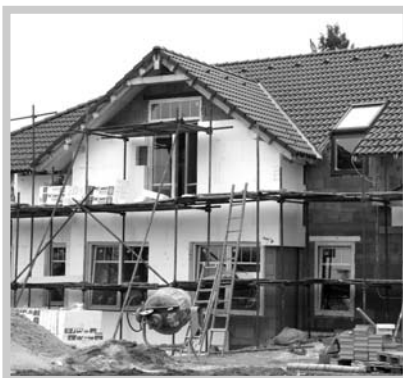
Hned jak to počasí dovolilo začali stavbaři zateplovat fasádu celého objektu.