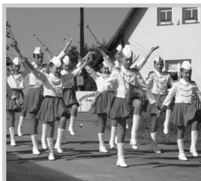
Kamenickým Hraběnkám to moc slušelo.