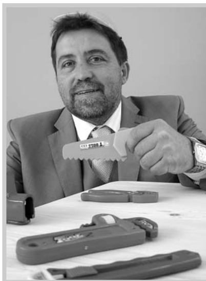
Na fotografii jsme si tentokrát dovolili trochu nadsázky. Po hektickém období je jistě na místě.

Děkuji také stavbařům i dalším dodavatelům, že v případě obou projektů dokázali dodržet termíny, které se zdály být po mnoha stránkách nereálné.