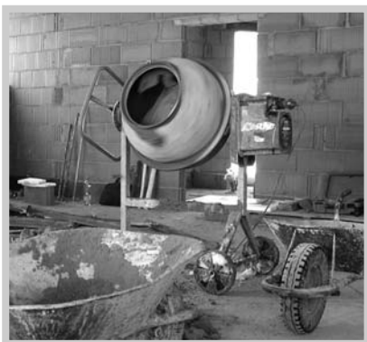
Od ledna 2011 pokračovaly stavební práce nepřetržitě uvnitř budovy.